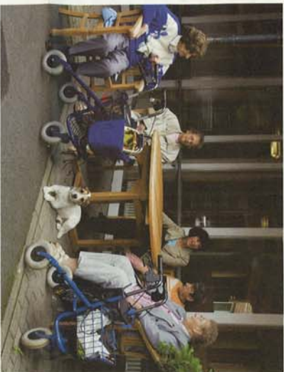
Viele Experten sehen in den Quartierslösungen eine zentrale Antwort auf die Herausforderungen der Zukunft, andere bezeichnen sie als „pure Sozialromantik“.

Hannover/Köln/Solingen (sts). Pflege-WG und Pflege im Quartier sind schöne Ideen – markthafte Alternativen zur stationären Pflege sind sie jedoch nicht. So lautet das zentrale Ergebnis in der diesjährigen Ausgabe des Terranus Pflege Reports. „Die jüngsten Vorschläge, ambulante Pflege im Quartier oder gar die „Pflege-WG“ als Alternative zum Heim zu etablieren sind pure Sozialomantik“, sagte Terranus-Geschäftsführer Hermann Josef Thiel bei der Vorstellung des Reports, der jährlich die wichtigsten Entwicklungen der Branche analysiert. „Ein sinnvolles Angebot entsteht nicht aus idealistischen Konzepten, sondern